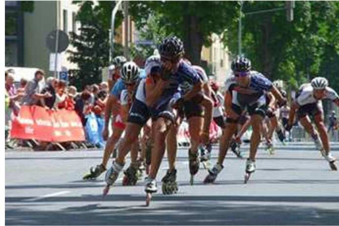
Mit 70 Sachen unterwegs