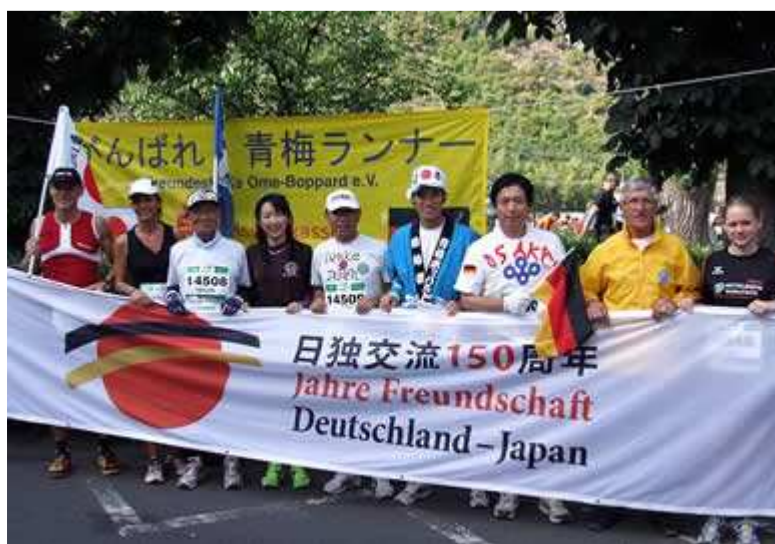
Freundschaft mit Japan

Auf der alten B9 gen Süden Richtung Bad Salzig. Nach dem Wendepunkt in Hirzenich ging es dieses Jahr auf der neuen B9, der altbekannten Strecke, wieder zurück nach Boppard und von dort den zum Ziel in Koblenz eilenden Halbmarathons hinterher.