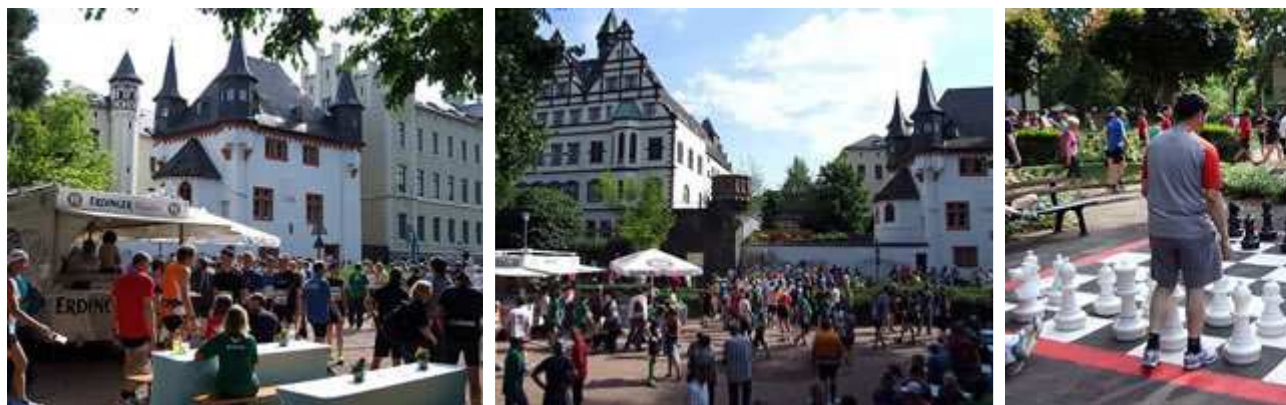
Warten auf den Start in Boppard

Von Läufern ist zunächst wenig zu sehen. Die südhessische Laufszene hat es in den letzten Wochen wohl schon zu den Marathons in Mainz und Mannheim gezogen und im Herbst wird traditionell wieder Frankfurt der regionale Marathon-Magnet schlechthin sein. Dafür überall Anti-AKW-Aktivisten, die zu Großdemonstrationen in den umliegenden Großstädten fahren. In Darmstadt sind es Fußball-Fans, die den Aufstieg des Traditionsvereins SV 98 in die 3. Liga miterleben wollen. Noch etwas sportlicher wird es aber erst im IC-Radabteil ab Mainz: jede Menge Fahrradtouristen, die von ihrer Tour an Rhein und Main nach Hause fahren oder dorthin aufbrechen.