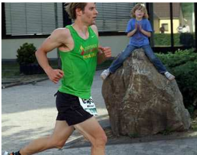
Auf geht's - vorwärts ...

a. auch Hautsponsor beim "Hochwald Gourmet Marathon" in Saarbrücken.