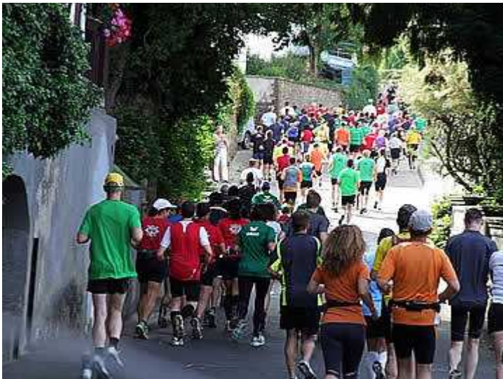
Die Läufer verlassen Boppard

Mentale Stärke braucht man aber trotzdem, um auf den kilometerlangen Geraden der B9 sein ‚einsames‘ Rennen durchzuziehen. Nur in den wenigen Orten alle paar Kilometer gibt es kleinere Stimmungsnester. Da stehen und sitzen die Menschen vor ihren Häusern und den Lokalen, oft mit einem Schoppen Rhein-Wein oder beim Glas Bier und jubeln den Läufern zu. Einige Tausend mögen es an der gesamten Strecke sein, doch wer Zehn- oder gar Hundert-Tausende von Zuschauern zur eigenen Motivation erwartet, der sollte eher einen der ganz großen, reinen City-Marathons laufen. Und beim Genuss der schönen Rhein-Landschaft mit ihren Weinbergen und den Burgen hat zuweilen dann doch auch die Bahn plötzlich wieder etwas Störendes an sich. Die Laufstrecke verläuft direkt zwischen dem Fluss und der viel befahrenen Eisenbahnlinie, auf der Zug um Zug lautstark vorbei fährt.