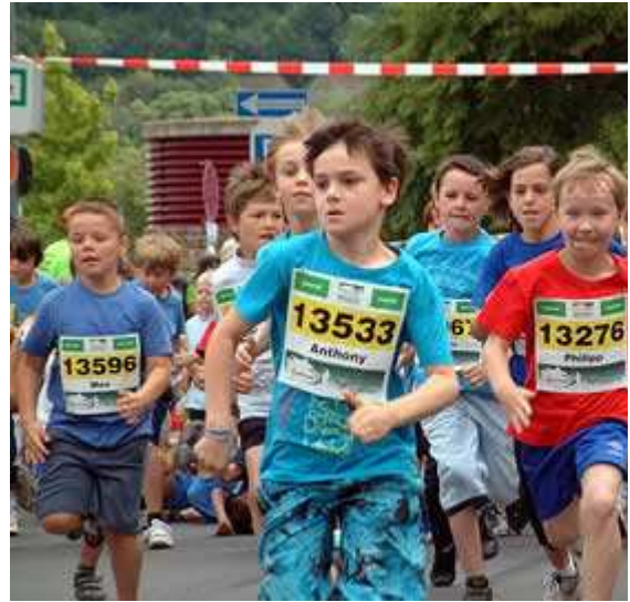
Großer Andrang und Begeisterung beim Mini Marathon

Ich möchte meinen Bericht nicht schließen, ohne vorher auf einen ganz besonders lobenswerten Programmpunkt im Angebot des "Mittelrhein Marathon e.V." hingewiesen zu haben. Noch lange bevor sich in Boppard und Rhens die ersten Teilnehmer zum Start über Marathon, Inline-Marathon, Halbmarathon und 10-Kilometer versammelten, rüsteten sich - kaum war das Mittagsbrot verdaut - auf der Mainzer Straße mehrere Hundert Schülerinnen und Schüler um über die Distanz von 1.000 Metern die Aufnahmefähigkeit des Zieleinlaufs der "Großen" am Mainzer Tor zu testen. Noch im letzten Jahr wurden an mehr als 250 Schulen und pädagogische Einrichtungen der Region um Koblenz Ausschreibungen versendet.