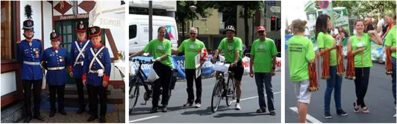
Ohne Helfer geht gar nichts und auch die Stadtwache Koblenz half z. B. bei der Bewachung des VIP Eingangs