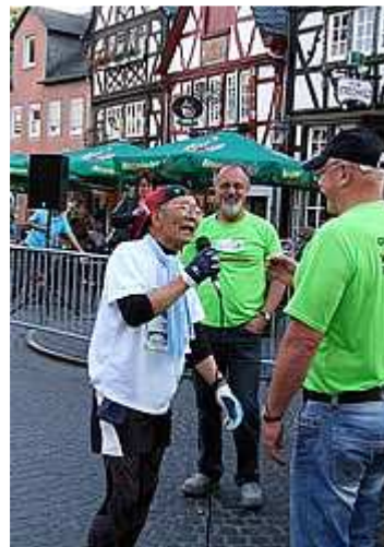
Der letzte des HM wird noch auf dem Marktplatz in Rhens interviewt