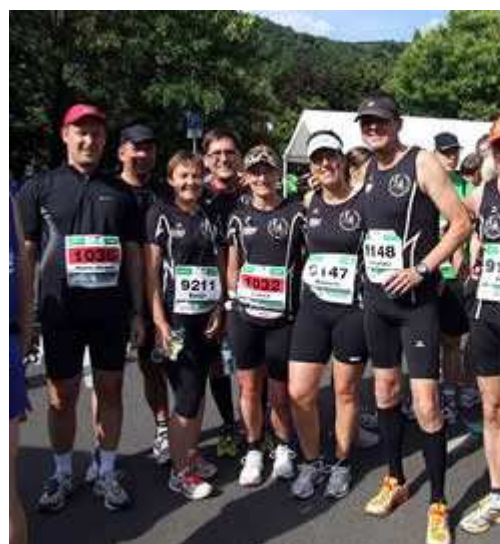
Gruppe von Meddys LWT Koblenz

Startort Oberwesel für die Marathondistanz ist ebenso Geschichte wie die der Loreley. Oder war es doch nur eine Sage, die Mär von der Jungfrau oben am steilen Fels? Der Anziehungspunkt zigtausender Touristen jährlich, ward den Teilnehmern des 7. Mittelrhein Marathons dieses Jahr verschlossen. Dabei hat der Gesang dieser ach so verführerischen Nixe auf ihrem Felsenthron noch