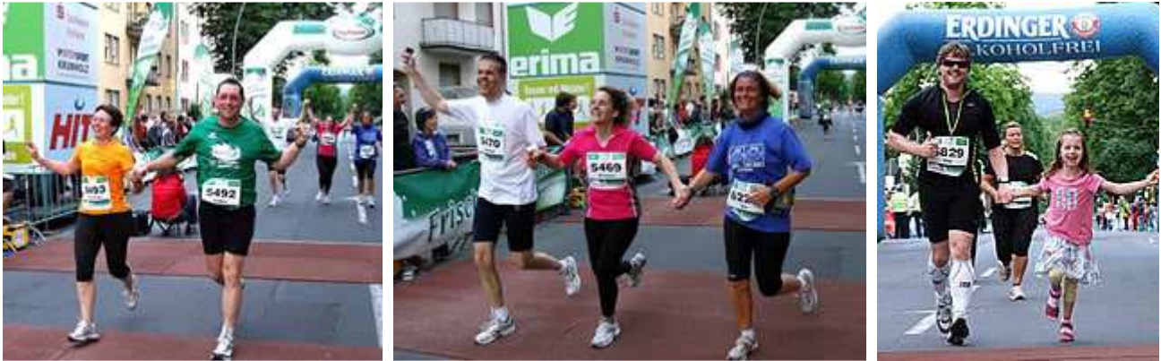
Glücklich im Ziel

längere Laufzeiten?" steht doppeldeutig auf dem Shirt eines Läufers, dessen Laufzeit heute allerdings nicht gerade zu den kürzesten zählen wird. Dass kürzere Laufzeiten jedenfalls gut geplant sein sollten, habe ich bei meinem Lauf heute selbst gemerkt: wer es zu schnell angeht, läuft Gefahr am Ende einzubrechen.