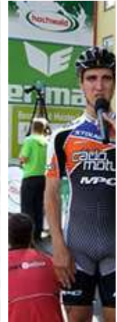
Spruyt, I CadoMotus: 00:

Von Anbeginn mit im Programm des Mittelrhein Marathon, die unterschiedlichen Skaterwettbewerbe. Die Veranstaltung in Koblenz zählt so auch seit Jahren mit zum "German Inline Cup" bei dem regelmäßig auch die Weltelite an den Start geht. Bis zu 70 km/h erreichen die Spitzenskater im Schlussspurt auf den Zielgeraden. www.laufreport.de ist nun nicht gerade das Medium dieser Sportart und der laufende Reporter will sich daher - nicht zuletzt wegen fehlender Kenntnis - auch an das Sprichwort aus der Schusterzunft halten und nur die Sieger nennen.