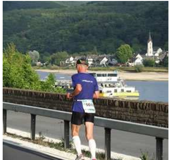
LaufReporter als einsamer Marathonläufer

Also konzentriert man sich am besten auf seinen Lauf und das eigene Tempo. Allerdings sollte man sich von der flachen Strecke und den Pacemakern nicht verleiten lassen, das Rennen zu schnell anzugehen. Leider passiert genau das mir - wieder einmal. Zu spät merke ich, dass der 3:15h-Tempoläufer die ersten 7 KM unter 4:30min./KM viel zu schnell läuft. Zu lange laufe ich in der kleinen Gruppe mit; als ich mich korrigiere, ist es zu spät. Bei KM 17 ist der Zug der 3:15h-Läufer für mich abgefahren. Die HM-Marke im Startort Boppard passiere ich noch in einer passablen Zeit, doch ich weiß längst, dass ich mein Marathon-Zeitziel nicht erreichen werde.